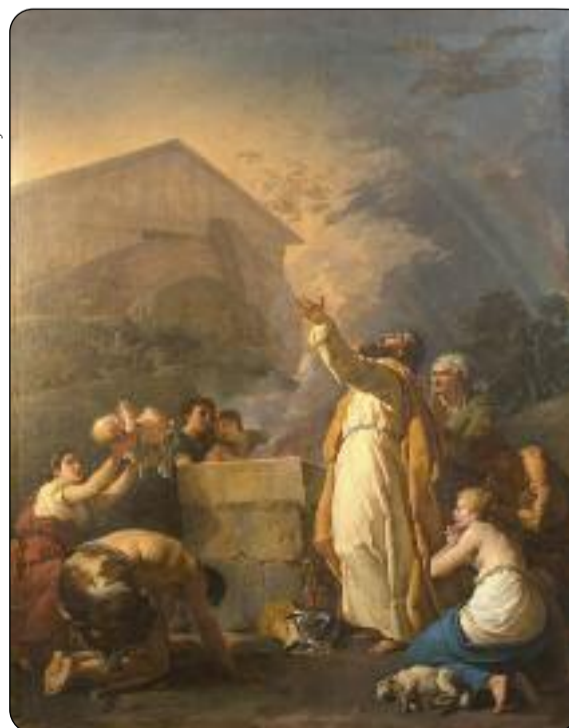
Jean-Hugues Taraval, Le Sacrifice de Noé , 1783. Huile sur toile. Paris, Eglise Sainte-Croix-des-Arméniens (COARC).