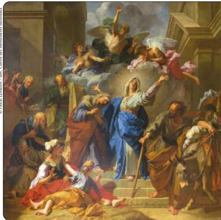
Jean Jouvenet, Le Magnificat , 1716. Huile sur toile. Paris, cathédrale Notre-Dame de Paris, dépôt du Louvre.