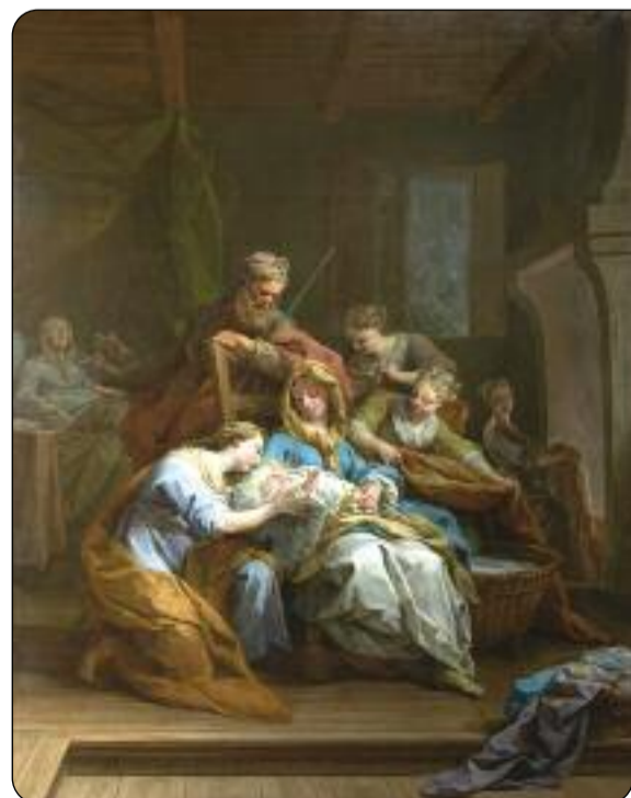
Jean Restout, La Naissance de la Vierge (Chapelle du séminaire Saint-Sulpice), 1744. Huile sur toile. Paris, Ivry (Saint-Honoré-d'Eylau) (COARC).

● Le baroque des Lumières. Chefs-d'œuvre des églises parisiennes au XVIII e siècle. Jusqu'au 16 juillet 2017, Petit Palais.