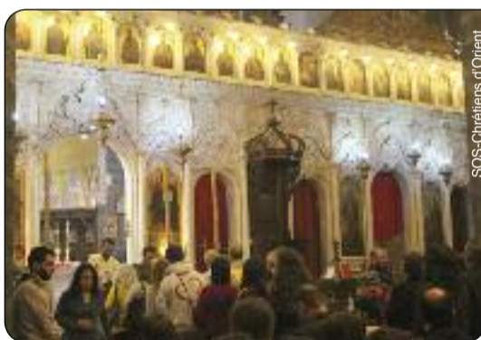
Messe dans l'église de Damas.

— Oui, beaucoup ! J'ai voulu les honorer. Les guerres de Vendée, on